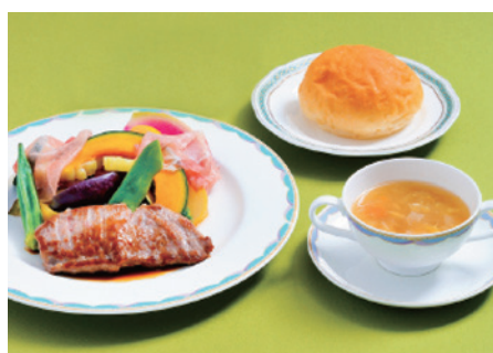
洋食ワンプレート(肉または魚) ¥2,500(税別)