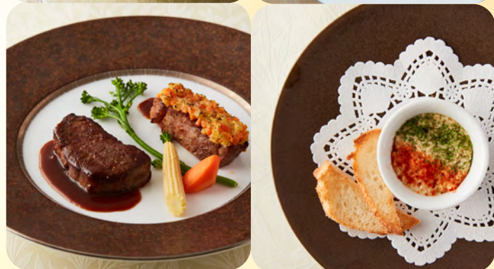
※コース料理イメージ