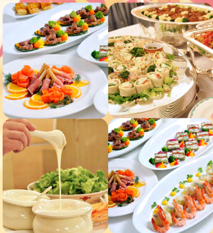
※盛り込み料理イメージ