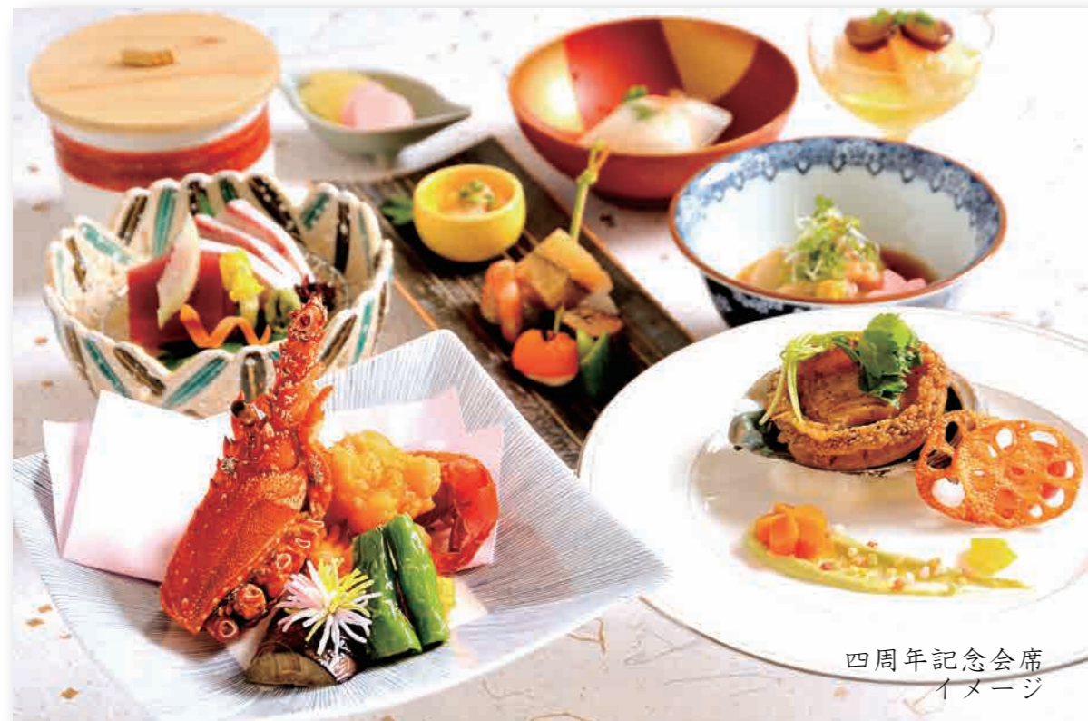
四周年記念会席 イメージ