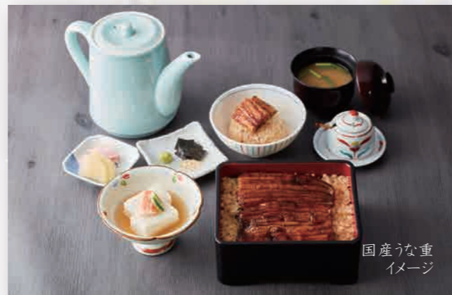
国産うな重 イメージ