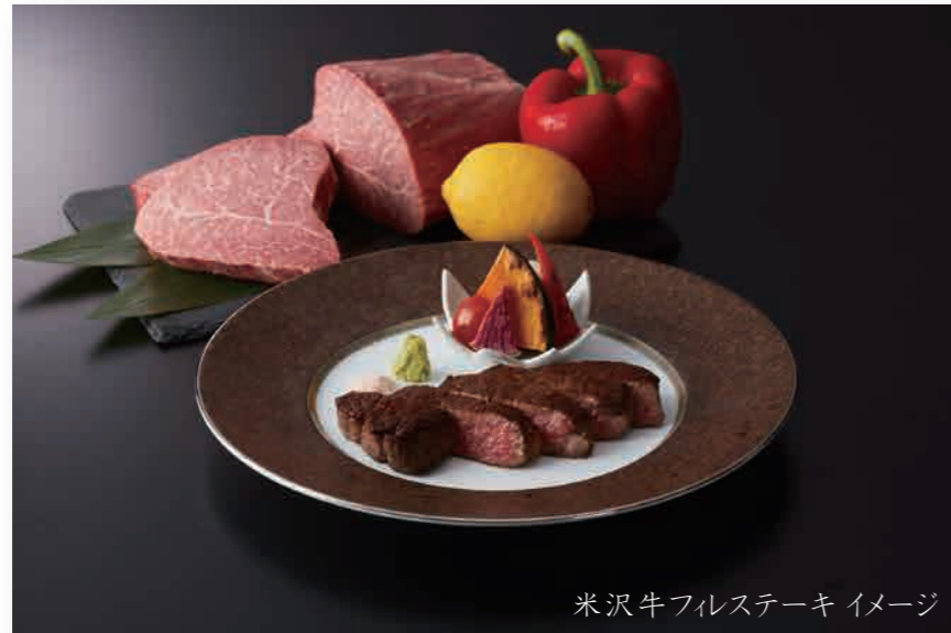
米沢牛フィレスステーキ イメージ