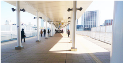
改札を出て右手へ。陸橋を直進します。