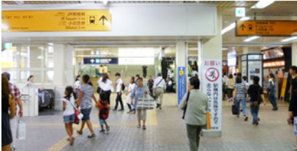
改札を出て直進します。