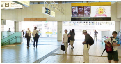
中央改札口を出ます。