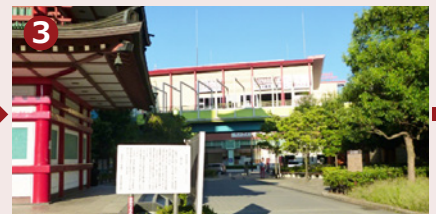
七重の塔の右脇を通り抜けます。