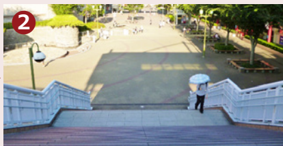
正面の階段を下りて七重の塔を目指します。階段右手にエスカレーター、エレベーターもごさいます。（雨の日は右手のピナウォーク内をご通行ください）