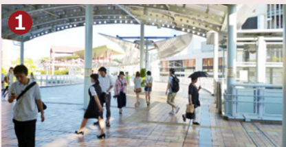
ショッピングモール「ピナウォーク」方向へ進みます。