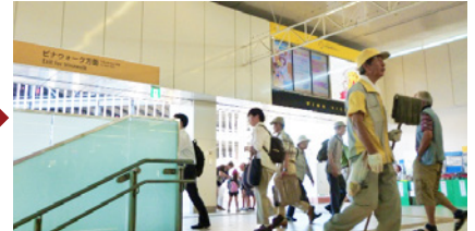
階段（エスカレーター）を上ったら左手へ。 戸外へ出たら、さらに左手へ。