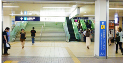
階段またはエスカレーターで上階へ。