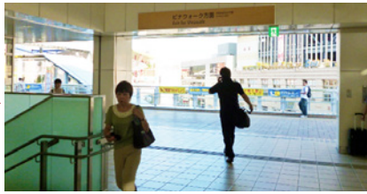
戸外へ出たら左へ。