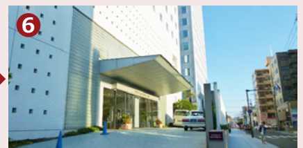
プライムタワー手前にホテル正面入口がごさいます。