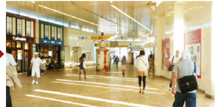
通路を直進し、戸外へ出たら左手へ。