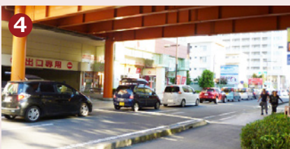
道路に出たら右に曲がり、直進します。