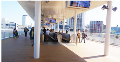
動く歩道を直進します。